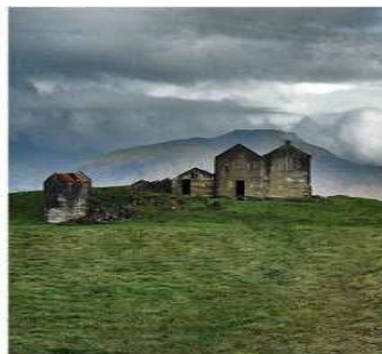
Photo 29: Décrivez la photo / Vous êtes plutôt pour les villes ou les villages ? Pourquoi ? / Que pensez-vous de l'idée de repeupler les villages avec des jeunes gens venus des grandes villes ?