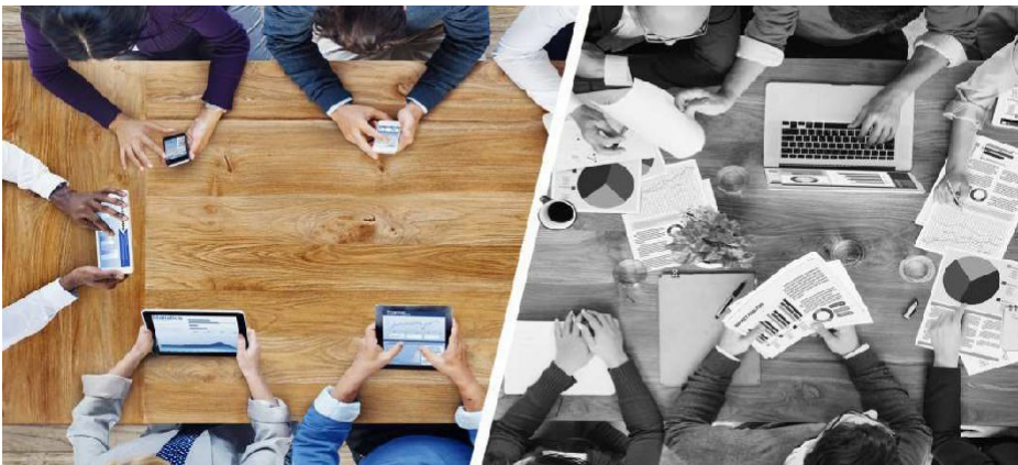
Photo 24: Décrivez la photo / Quels sont, selon vous, les principaux inconvénients des nouvelles technologies ? / Les ordinateurs disparaîtront dans quelques années ?

Monologue du candidat (présenter, décrire et interpréter la photo) et questions du jury sur la photo et le thème qu'elle véhicule.